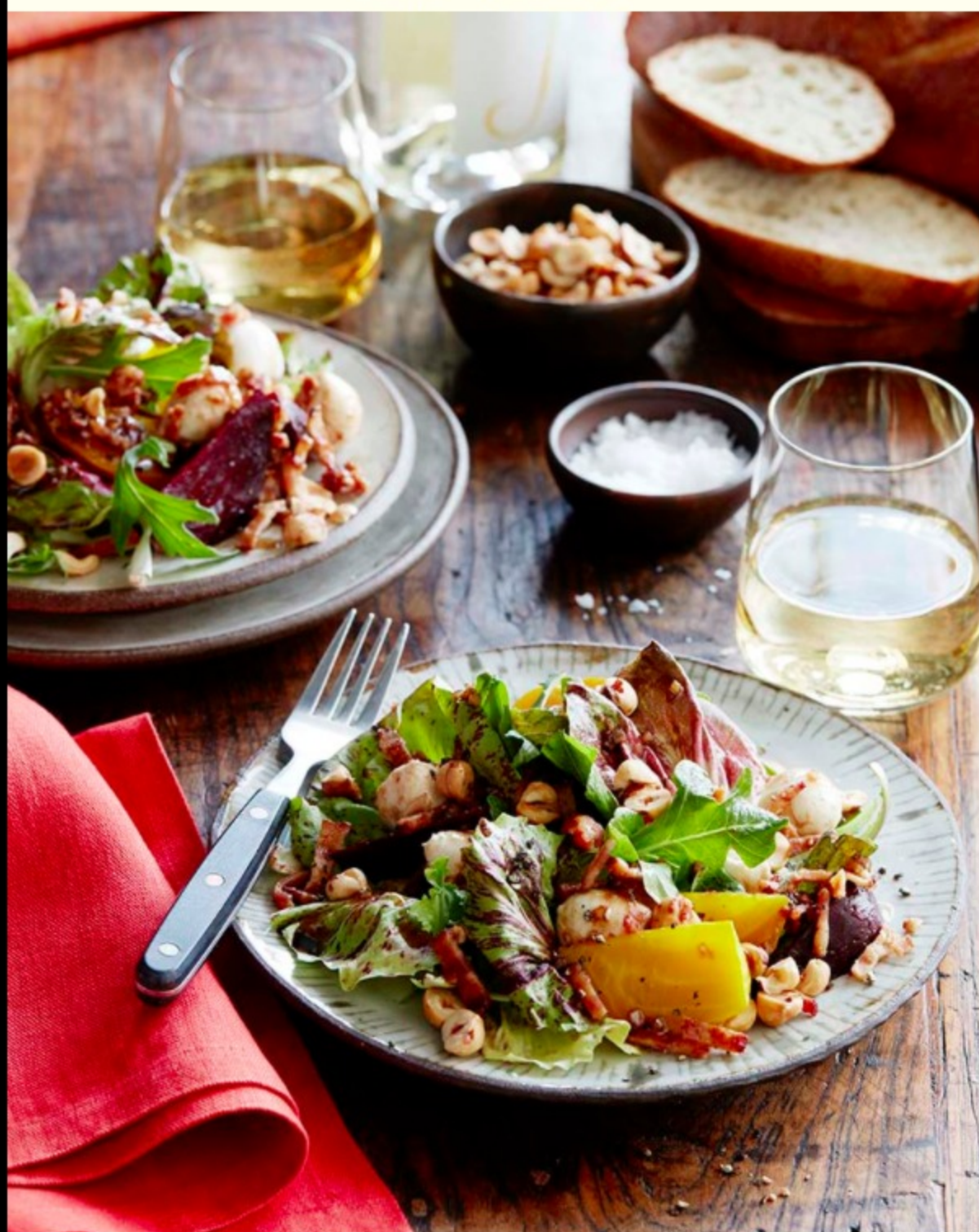
從農場到餐桌 烘烤甜菜、榛子與新鮮莫札瑞拉起司搭配蜂蜜培根油醋醬